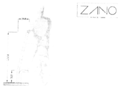
wymiary podane w [mm]