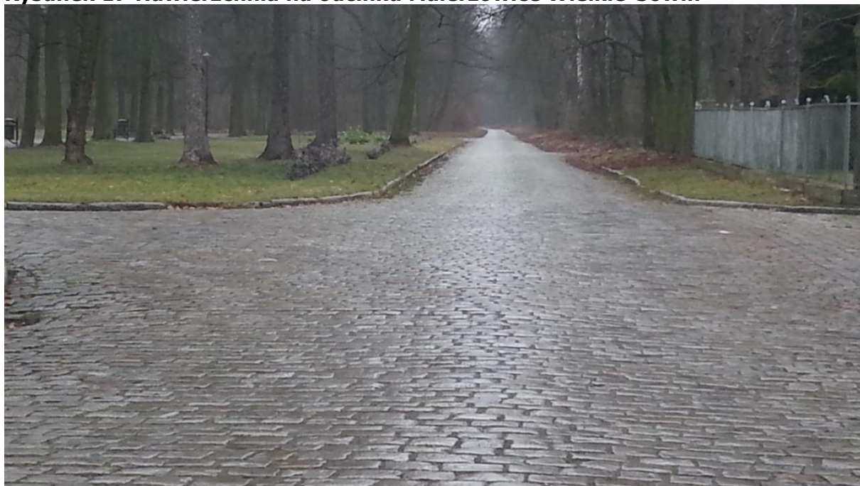
Rysunek 17 Nawierzchnia na odcinku Malerzowice Wielkie-Sowin