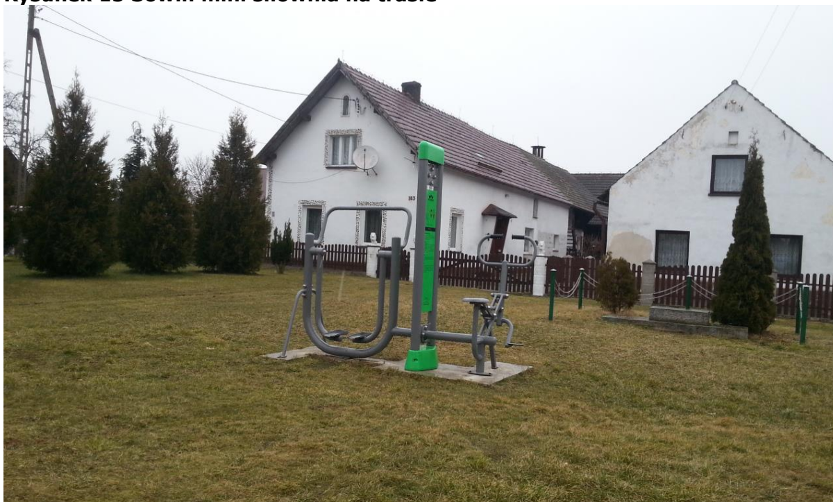
Rysunek 15 Sowin mini siłownia na trasie