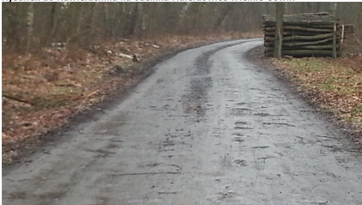
Rysunek 16 Nawierzchnia na odcinku Malerzowice Wielkie-Sowin

biuro@partnerstwo-nyskie2020.pl partnerstwo-nyskie2020.pl