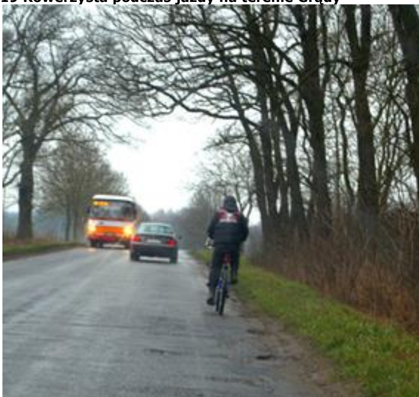
Rysunek 19 Rowerzysta podczas jazdy na terenie Grady

biuro@partnerstwo-nyskie2020.pl partnerstwo-nyskie2020.pl