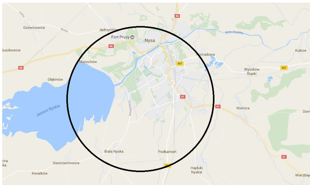
Ryc. 2. Obszar na którym zlokalizowane są obiekty objęte przedsięwzięciem termomodernizacji